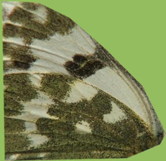
Figs. 4 y 5. Pontia daplidice . Fondo verde salpicado de manchas blancas, algunas de las cuales se fusionan en una característica franja transversal (en rojo, fig.4).

3. El reverso de las alas posteriores es de color verde con manchas blancas pero no llegan a reunirse formando ninguna banda transversal. El patrón de diseño es más bien reticulado.....4