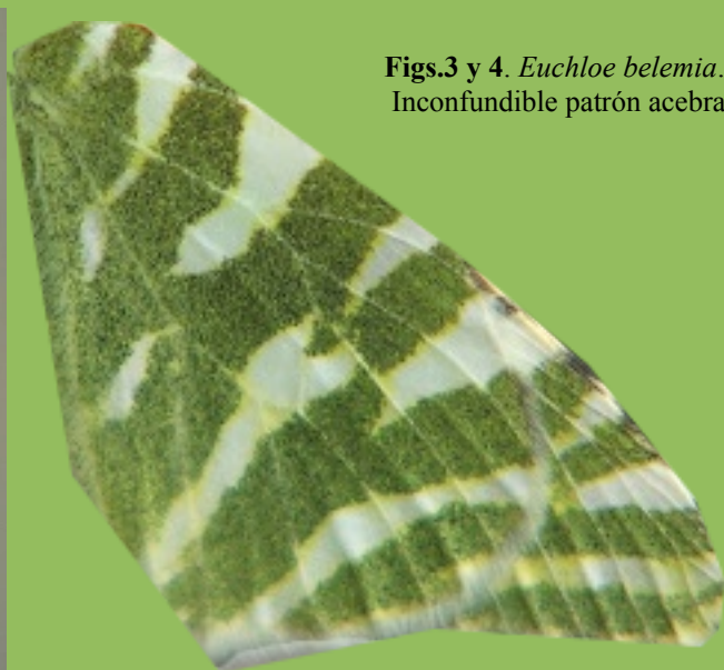
Figs.3 y 4. Euchloe belemia . Inconfundible patrón acebrado.